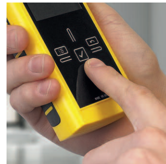
T610 en T660 hebben een doorlopend oppervlak van zeer krasbestendig Blanview-speciaalglas met capacatief touch-bedieningspaneel.

Door de microgolfttechnologie kan met de T610 niet alleen de vochtverdeling tot op een diepte van maximaal 300 mm worden gedetecteerd, maar is het proces ook onafhankelijk van de verziltingsgraad van het materiaal. Bij het microgolffproces speelt het daarom geen rol of een oud of een nieuw bouwwerk wordt onderzocht.